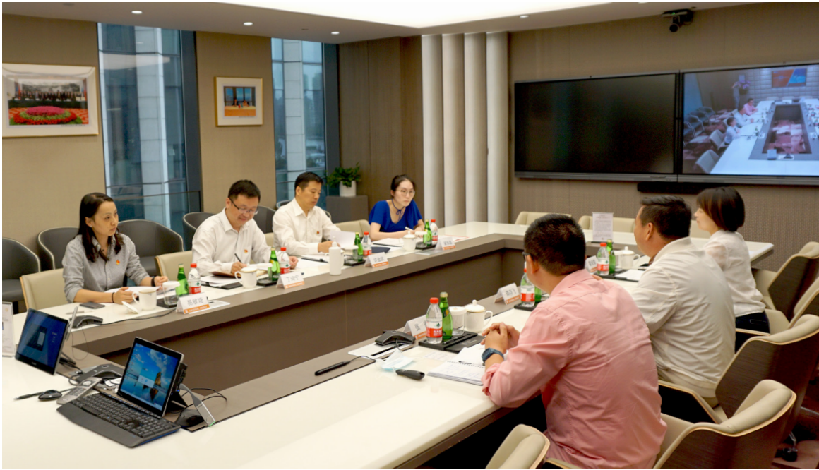
▲ 座谈会上，丁书记一行了解企业情况