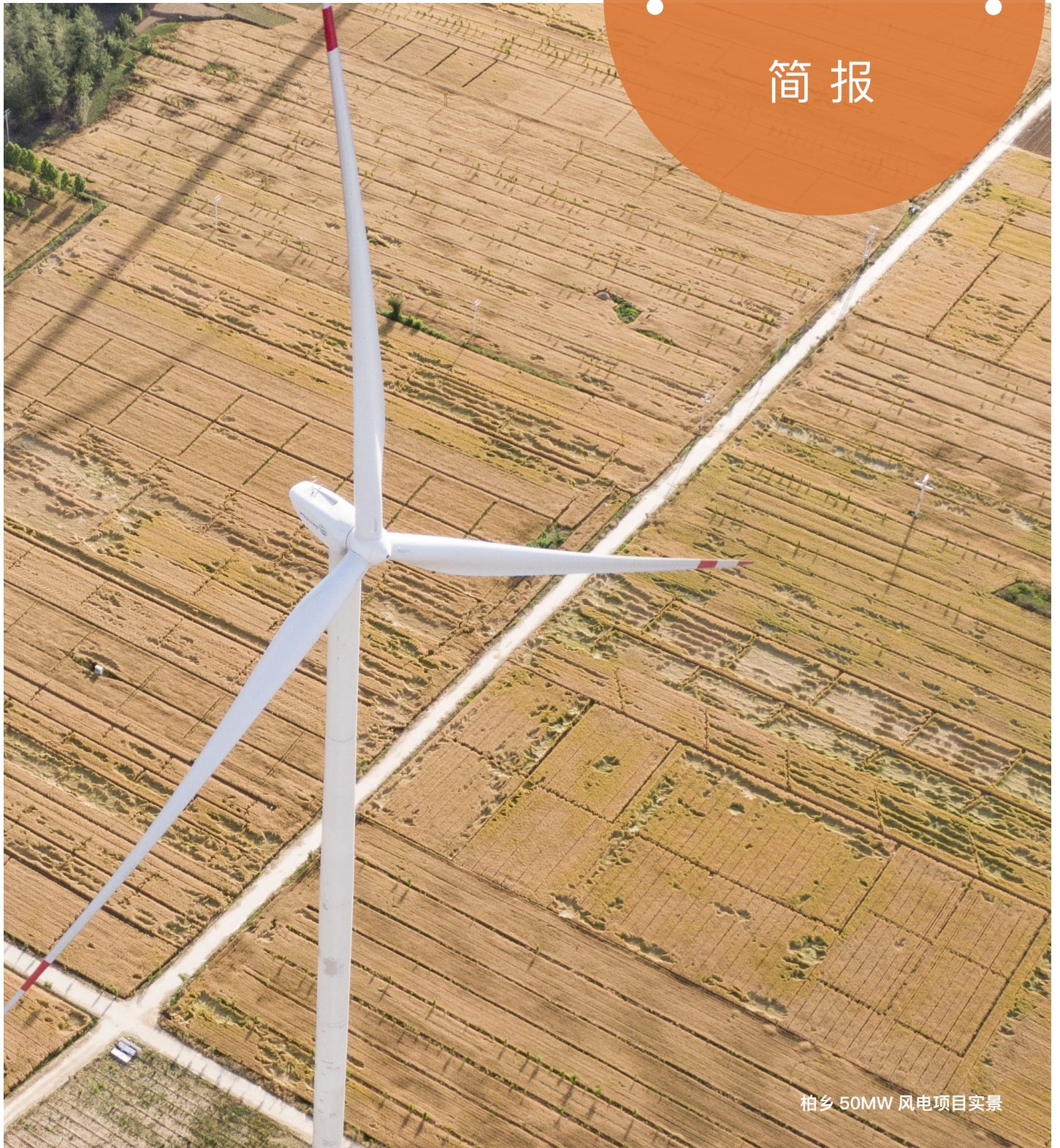
柏乡 50MW 风电项目实景