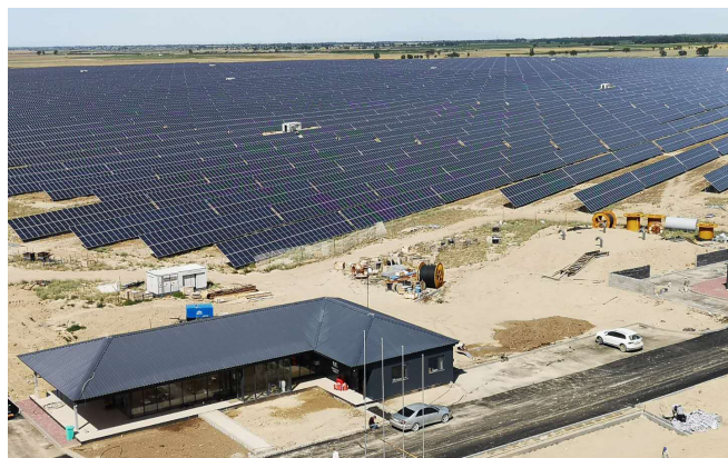
▲ 在大家的合作努力下，项目渐渐成形

而大发雷霆时，局促而又略显羞赧的三号集电线路的分包商材料员，当然，还有他的老板，哈纳斯先生，想起他我就随之想起周家理因为收到他在晚上接连发来的数以十计的平均时长 50 多秒的微信语音时而摇头苦笑的样子。