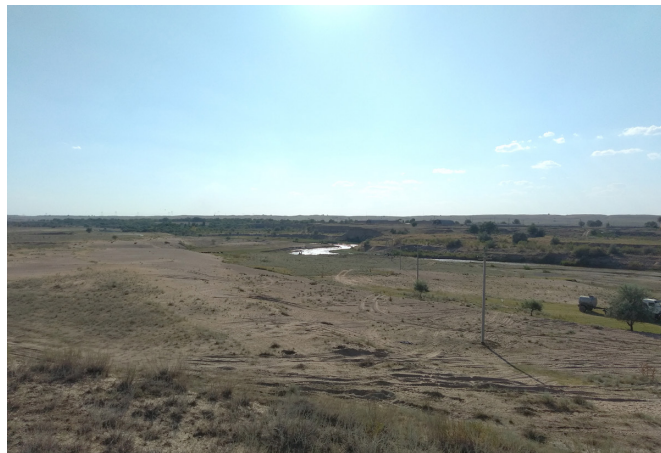
▲ Kaskelen 河静静流淌

当然在这过程中我们也更了解了哈萨克这个更随性，更乐观的民族。因为即使是在最恶劣的环境下，他们也能让施工现场保持一种欢快的节奏。此外，我们还了解到哈萨克是一个讲情谊的民族。比如王彬因为与监理建立了朋友般的情谊，监理竟利用休息时间不知疲倦地为我们寻找出租房；比如董峰因为与分包商 Nazar energy stroy 的老板哈纳斯建立了兄弟般的情谊，在项目尾期，他们竟为我们免费除草三天。在那段张弛有度的施工期间，很多当地工人给我留下了深刻的印象。我记得有个熟知地理的组装工，总是喜欢给我们背诵中国各省份名和美国各州名；还有一个叫斯塔斯的俄族包工头，总是像喜剧演员一样模仿监理单眼目测支架垂直度的样子；还有那个用老款三菱轿车拉砖，精于打桩的马尔丹；哦，还有那个在苏永伟因为其材料管理混乱