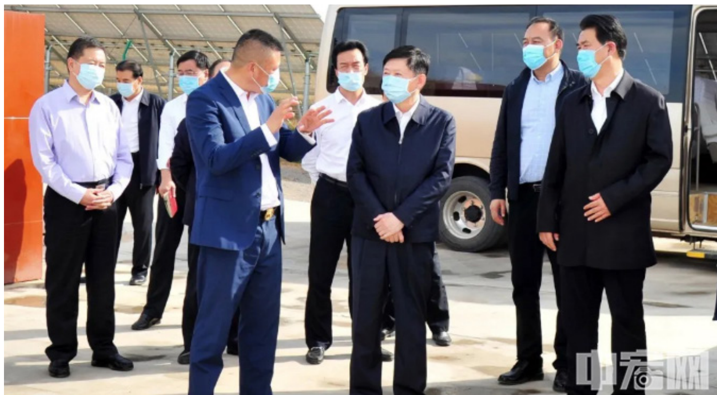
▲ 石家庄市委书记邢国辉（右三）一行实地考察寰泰能源灵寿 35MWp 光伏扶贫电站

2020年10月13日下午，河北省常委、石家庄市委书记邢国辉在石家庄市灵寿县调研检查脱贫攻坚工作时，来到寰泰能源灵寿 35MWp 光伏扶贫电站视察。在实地查看了项目建设及运行情况后，他指出要按时兑现贫困户收益，提高土地利用效率，实现扶贫与发展的“双赢”。