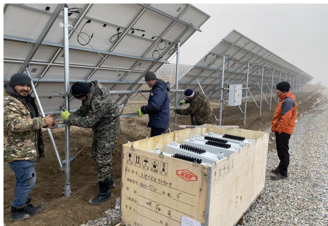
▲ 现场正在安装汇流箱支架