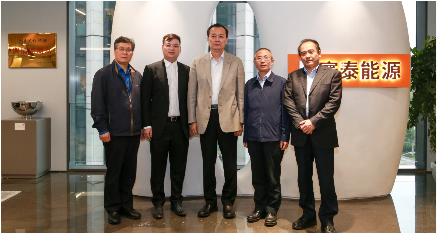
▲ 黄副主席（中）一行与南逸董事长（左二）亲切合影

2020年10月14日下午，全国工商联副主席黄荣率队莅临寰泰能源调研。上海市工商联主席寿子琪等陪同参观考察，寰泰能源董事长兼总裁南逸等接待。