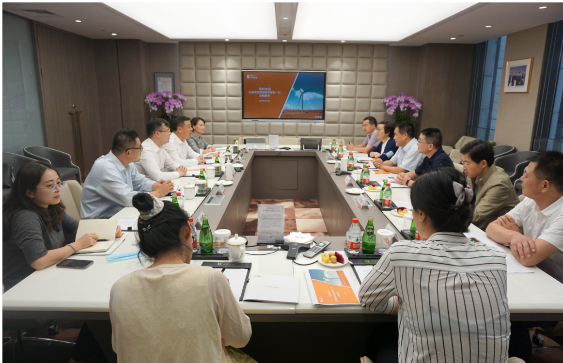
▲ 吴部长一行调研寰泰能源，深入了解企业发展情况