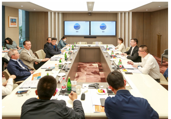
▲ 座谈会上，黄副主席一行聆听企业情况

黄副主席听后建议可先从企业自身出发，进一步细化、整合需求，提出有针对性、可操作的措施，全联将积极发挥职能作用，把企业遇到的问题反应给有关部门和当地政府。针对融资难的问题，他指出，全国工商联已与中国工商银行、中国建设银行分别签署战略合作协议。“八融”措施、“八大平台”将为民营企业的高质量发展赋能。寰泰可通过全联与银