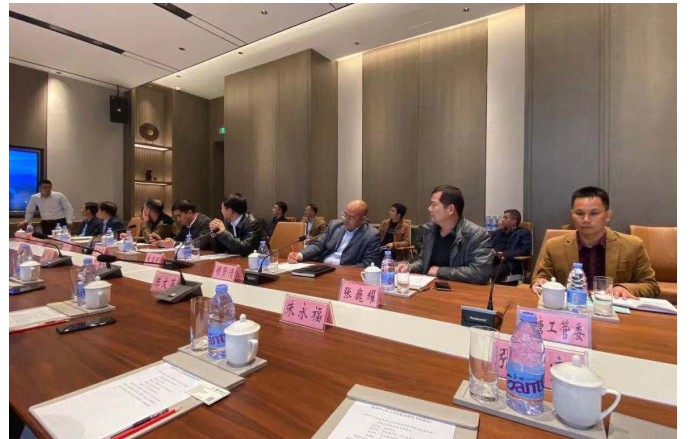
▲ 寰泰团队与宾阳县领导座谈