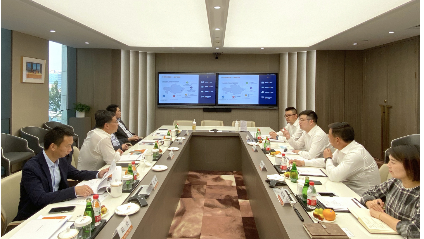
▲ 南逸董事长介绍企业情况