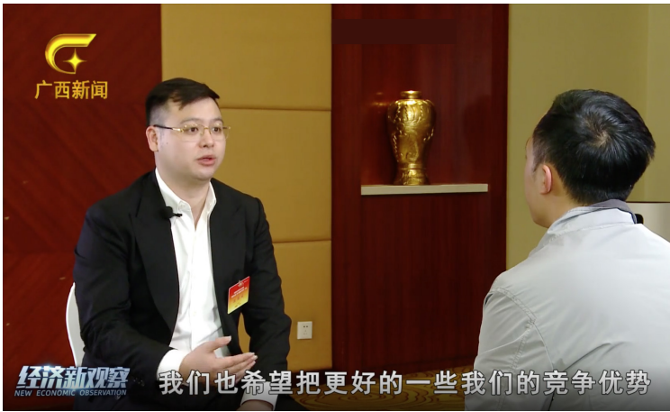
▲ 南逸董事长接受广西媒体专访，介绍公司发展情况

当地政府对公司实力、能力的认可，为寰泰团队此次广西之行画下了圆满的句点，为公司未来在广西的发展开了个好头。