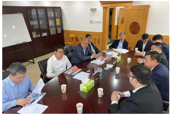
▲ 南逸董事长一行拜会南宁副市长朱会东

随着更多清洁能源项目在广西落地，公司业务布局进一步完善，为拓展东南亚市场，继续推动共建“一带一路”高质量发展奠定了基础。（安安/文）UE