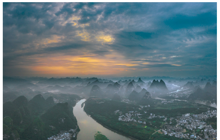
▲ 广西拥有开发风电项目得天独厚的条件，整体风电规模较大

今年 9 月，习近平总书记在第七十五届联合国大会上做出了中国“二氧化碳排放力争于 2030 年前达到峰值，努力争取 2060 年前实现碳中和的庄严承诺，为清洁能源赋予了新使命；11 月，以东盟为核心推动的区域全面经济伙伴关系协定（RCEP）签署，为清洁能源领域的国际合作提供了新机遇。以此为契机，寰泰能源对更广泛的清洁能源市场展开了积极